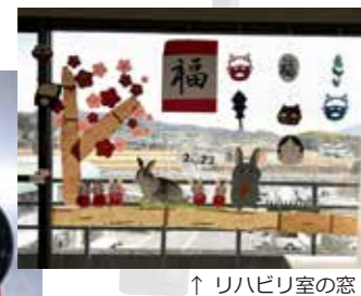
↑ リハビリ室の窓 ← 節分メニュー 助六寿司