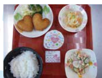
↑ ハート型のココロケ