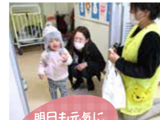
明日も元気に遊ぼうね!