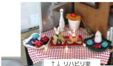
↑ ↓ リハビリ室