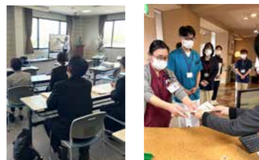
↑ 88ホールにて講義のようす ↑ スタンプラリーのようす

今年こそは、100点満点以上の研修を、と意気込んで2日間の研修に取り組んだ。4月1日が水曜日で病院休診日に当たるため、やむなく2日(木曜日)・3日(金曜日)の日程になった。