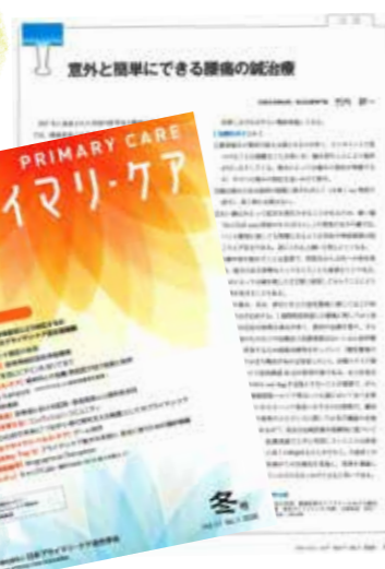
↑ 日本プライマリ・ケア連合学会会誌 vol.11

漢方外来は、一般内科外来や救急外来も同時に行っていることもあり生命に関わる急患の方を優先させていただいております。そのため、ご予約の患者さまであっても長時間お待ちいただく場合がございます。そのような際にも、皆さまに快く「かみ」の時間としてご理解いただきましたこと感謝申し上げます。 これからも、当院漢方外来が健康維持のわき役として皆さまのお役に立てますよう努めてまいります。引き続きよろしくお願いたします。