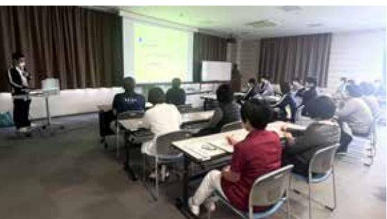
↑ 88ホールにて講義のようす

認知症の症状や行動パターン、その背景にある要因について学び、症状への具体的な対応方法について理解を深めました。