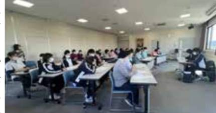
↑ 88ホールにて講義のようす

私たちも、ご利用者やご家族と関わる中で「あれ、おかしいな?」と感じることがあれば、職場内で速やかに話し合いを行い、早期発見・早期対応につなげていくことが大切であると改めて認識しました。