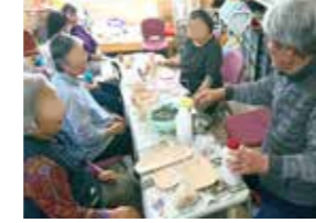
色を付ける際は釉薬を使用します。釉薬は、成分によって透明になったり、白、緑、黄色、茶色などの色がでたり、基本的に焼かれることで色が出ます。