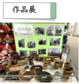
玄関に作品を展示しています。いろいろな色や形で世界にひとつしかない素敵な作品ばかりです。