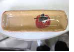
本焼きでは1200度で焼成をします。窯から作品を取り出すドキドキの瞬間！どのような作品になっているのか焼きあがるまで分からないところが面白くもあり奥深さでもあります。