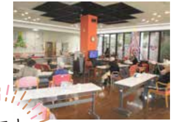
<座席レイアウトを放射線状に変更>