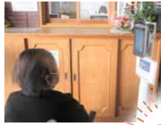
<体温測定とマスクの確認>