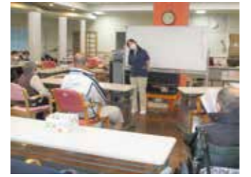
<レクリエーション>

昼食後には、口腔ケアを行います。口腔用品は持参していただきご自身でされる方への声かけと介助が必要な方にもご自身でできるところはしていただいています。また、レクリエーションの時間には、楽しさを感じていただくのはもちろんのこと、身体機能の維持を目的とした体操やゲームを日々趣向をこらして行っています。